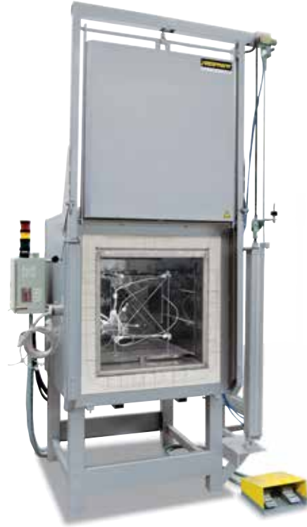
Isı düzgünlüğünün belirlenmesinde kullanılan ölçüm sehпасı

Standart fırın modelinde fırın içinde herhangi bir ölçüm yapılmaksızın +/- K toleransındaki bir ısı düzgünlüğü garanti edilir. Nominal sıcaklık değerinde kullanım bölümünde DIN 17052-1 normuna uygun bir ısı düzgünlük ölçümü yapan ilave donanım sipariş edilebilir. Fırın modeline bağlı olarak fırın içine, kullanım bölümü ölçülerine uygun bir ölçüm sehпасı yerleştirilir. Bu ölçüm sehпасında tanımlanmış olan 11 ölçüm pozisyonuna termo elemanları sabitlenebilir. Isı dağılımının ölçümü müşteri tarafından verilmiş olan ve önceden tanımlanmış olan tutma süresine göre olan nominal sıcaklık değerinde gerçekleşir. Talep edilmesi halinde farklı nominal sıcaklık değerleri veya tanımlanmış olan bir nominal çalışma aralığı da kalibre edilebilir.