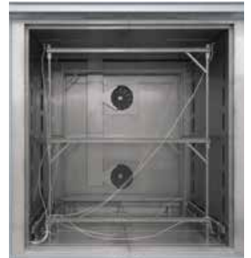
Hava dönüşümlü hazneli fırınlar N 7920/45 HAS için geçmeli ölçüm çerçevesi